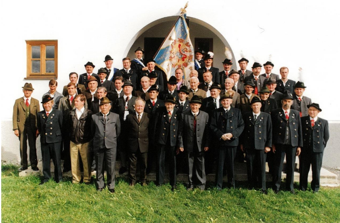
Vereinsfoto von 1991