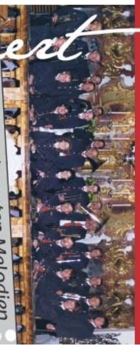
Mit bekanntesten Melodien