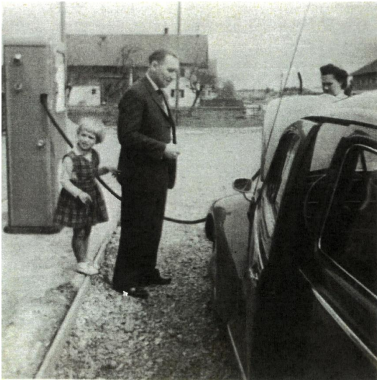
Tankstelle an der Raiffeisenbank