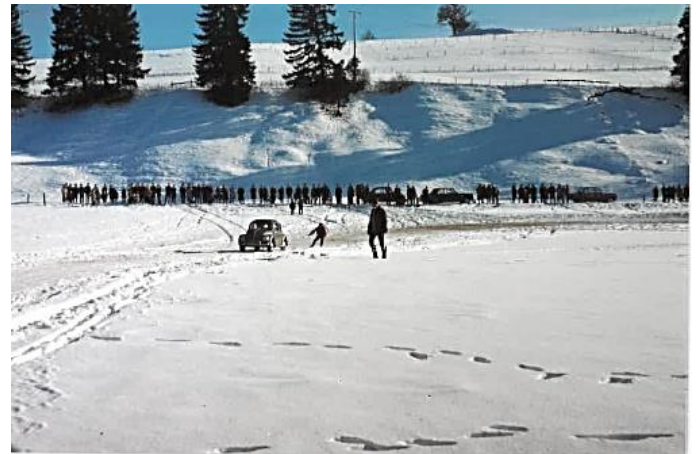
Skijöring (vor 50 Jahren)